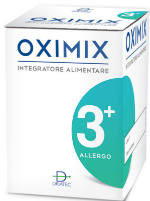
Oximix 3+ Allergo

Si utilizzerà 1 capsula a prima colazione iniziando l'assunzione dalla fine di febbraio e proseguendo per tutto il periodo di reattività allergica e comunque almeno fino alla fine di giugno. In fase acuta è possibile raddoppiare il dosaggio assumendo 1 capsula anche a cena per 7-10 giorni consecutivi.